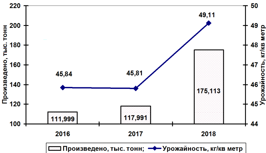
Рис. 1. Производство и урожайность тепличных овощей в Республике Беларусь

Тепличное овощеводство республики, как отрасль характеризуется стабильностью производства и динамичным развитием (Рис. 1). В настоящее время тепличный комплекс страны это 21 крупнотоварное предприятие, которые производят на общей площади 250,5 га более 94% тепличной продукции.