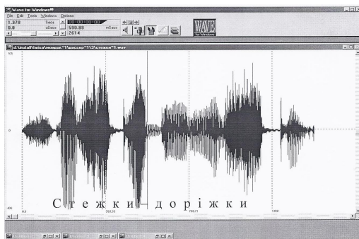
Рис. 1.1. Інтонограма юкстапозита стежки-доріжки

Підсумком третього етапу було отримання кількісних значень тривалості звучання всього двокомпонентного слова й великого компонента. Приклади вимірювання вказаних характеристик у юкстапозитів стежки-доріжки і спогади-думи за допомогою комп'ютерних інтонограм подані на рисунках 1.1. і 1.2.