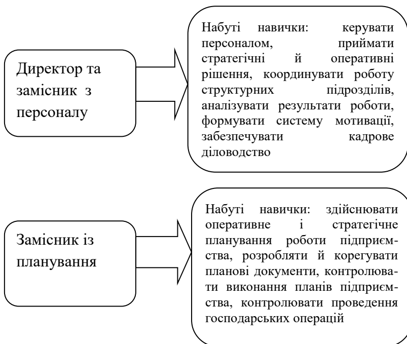
Рис. 1. Приклади моделей, створених студентами

Функції керівництва у будь-якій сфері сьогодні передбачають готовність самого керівника продемонструвати свою компетентність для публічного обговорення і узяти до уваги те, що скажуть йому підлеглі, він має показати, що його рішення принесуть корисні результати, переконати у необхідних діях свій персонал, скорегувати свої погляди, якщо це необхідно. Для визначення майбутніми фахівцями стану якості самовдосконалення їм пропонувалися інтерактивні вправи «Пізнай себе», «Займи позицію», «Портрет незнайомця» тощо.