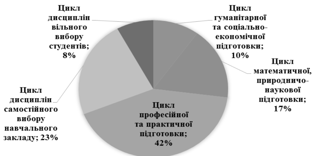
Рис. 1. Розподіл навчального часу за циклами підготовки бакалаврів за напрямом 6.050102 «Комп'ютерна інженерія»

Частка дисциплін циклу математичної, природничо-наукової підготовки досить велика – 17 % (рис. 1), зокрема на дисципліну «Фізика» передбачено 270 годин (5 кредитів ECTS), що складає 18 % від загальної кількості дисциплін цього циклу (рис. 2). Отже, фізика є фундаментальною дисципліною у підготовці бакалавра з комп'ютерної інженерії.