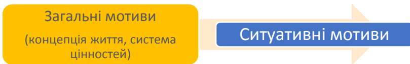
Рис. 5 Ієрархія мотивів гірничого інженера

Відповідно до різних потреб (матеріальних та духовних), які покладено в основу мотивів, окреслюють групи мотивів. Зауважимо, що соціальна природа суб'єкта відображається на мотивації та потребах майбутнього гірничого інженера (рис. 5).