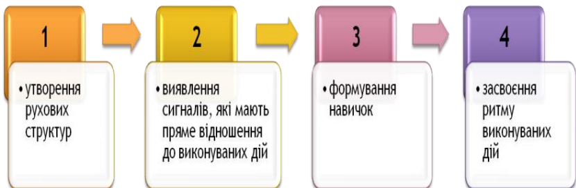
Рис. 3 Процес формування трудових навичок