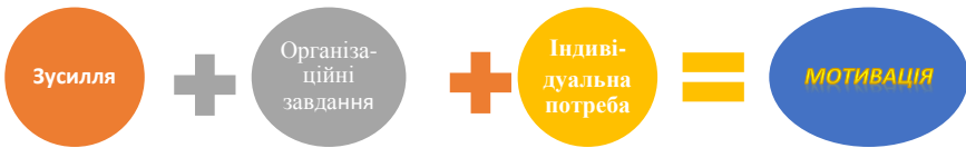
Рис. 4 Формула мотивації адаптаційного процесу гірничого інженера

Оскільки визначальним чинником будь-якої діяльності є фахівець із конкретними потребами та можливостями, рівнем соціальної й інтелектуальної свідомості, ціннісними орієнтирами, проблему мотивації варто розглядати крізь призму спеціаліста з його вимогами, психологією й філософією життя [2]. Тобто, початковим пунктом управління за допомогою мотивації є мотиви гірничих інженерів. Відтак зміст мотивації випускників гірничих факультетів в умовах сучасного підприємства має охоплювати три ключових поняття: зусилля, організаційні завдання й індивідуальні потреби (рис. 4).