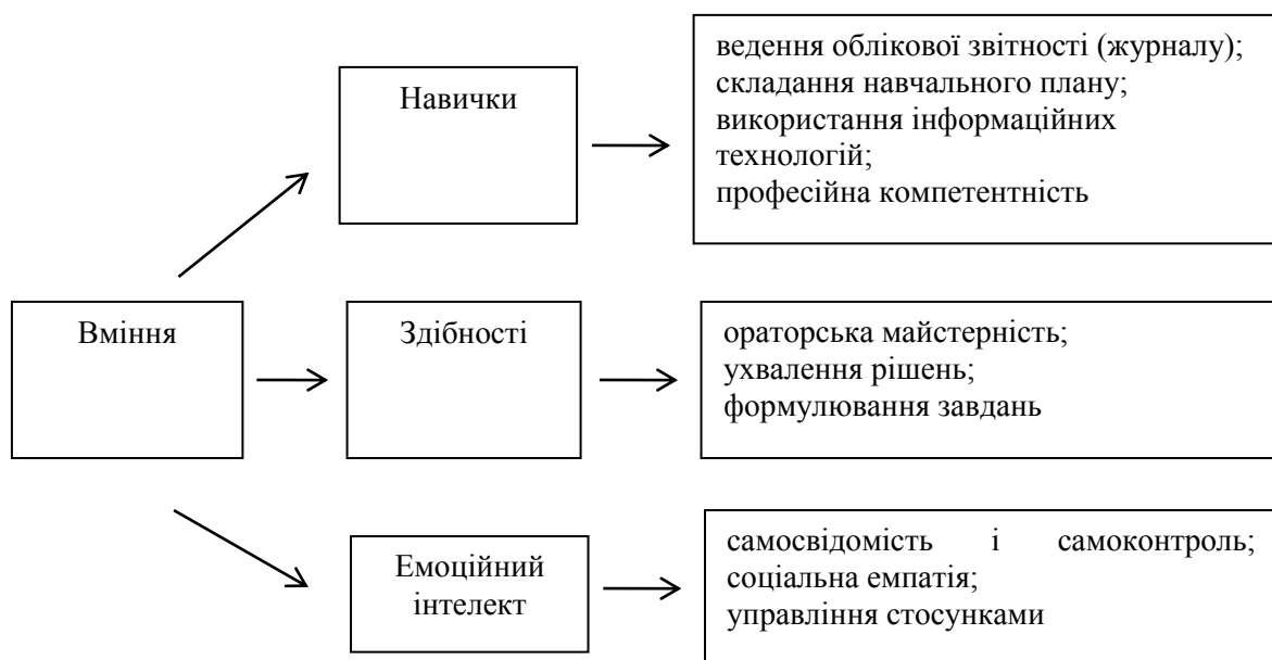
Рис. 1. Класифікація компетенцій, що необхідні для ефективної діяльності вчителів [7]

Згідно з Д. Гоулманом, емоційний інтелект – це «здатність людини пояснювати власні емоції та емоції оточуючих з тим, щоб використовувати отриману інформацію для реалізації власних цілей» [1]. Р. Бар-Он по-іншому визначає емоційний інтелект: «безліч некогнітивних здібностей і навичок, що впливають на здатність успішно справлятися з вимогами і тиском оточуючих».