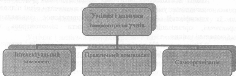
Рис. 1. Складові компоненти умінь і навичок самоконтролю

збагачення знаннями і навичками сприяє вдосконаленню умінь; навички і уміння необхідні для подальшого набуття знань.