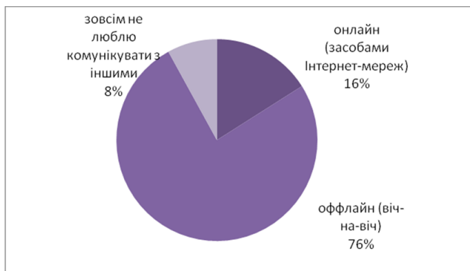
Рис. 1. Результати тесту щодо визначення зацікавленості спілкуванням онлайн

Водночас є респонденти, які не мають бажання спілкуватися з носіями інших мов і представниками інших культур. Тішить те, що більшість (77,8%) позитивно ставиться до можливого майбутнього міжкультурного обміну цінностями. І хоча зараз не всі з них мають онлайн-друзів з інших країн, вони позитивно налаштовані до міжнародних знайомств. На питання: «Чи зацікавлені Ви у спілкуванні з носіями інших мов?», — було надіслано такі відповіді (див. рис. 2):