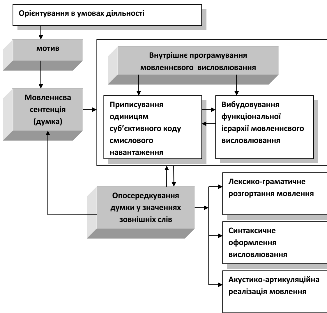
Рис.2. - Модель породження мовлення (за О.О.Леонт'євим)

Більш структуровано інтерпретує процес породження мовлення як послідовність взаємопов'язаних фаз діяльності О.О.Леонт'єв [4; 5], модель якого (рис.2.) створена на підставі фундаментального аналізу концептуальних положень теорії мовленнєвої діяльності Л.С.Виготського та теорії діяльності О.М.Леонт'єва.