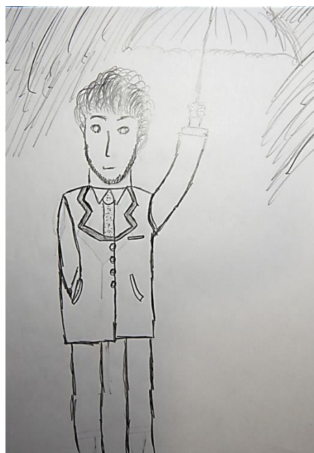
Рис.2. Малюнок досліджуваного 4

Лише 35% студентів зобразили в якості героя відповідний нормативний образ, а решта використовували заміщення: 25% зобразили дитину (відображає прагнення до регресії на більш ранній етап розвитку, домінування дитячого початку), а 40% обрали чоловічий образ (відображає прагнення до маскулізації). Вік і стать відображають переважаючу модель поведінки в умовах дії неблагополучних факторів.