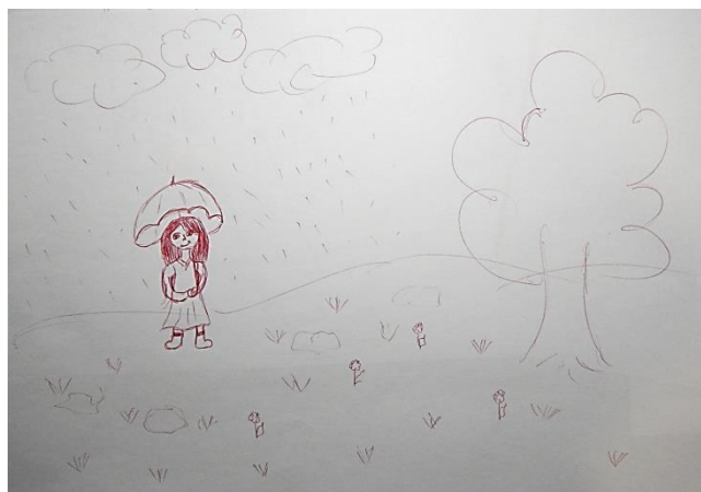
Рис. 4. Малюнок досліджуваної 11

У нашому дослідженні ми отримали 35% малюнків із зображенням калюж, але подекуди сам герой, що зображується, стоїть в калюжі, тобто знаходиться в несприятливій ситуації (15%). Калюжі, як правило, малюють люди чутливі, що довгий час перебувають в післядії стресу.