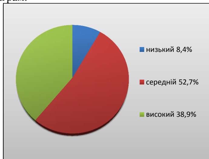
Рис. 1. Показники рівнів агресії

З метою визначення рівня та форм агресії була використана методика діагностики показників і форм агресії Л. Г. Почебут. Під час тестування виявилось, що з високим рівнем агресії спостерігається 38,9% учнів, а середнім рівнем – 52,7%. Низький рівень показали 8,4% досліджуваних. Також, за допомогою отриманих даних ми встановили, що більшій частині учнів притаманна вербальна агресія – 30,5%, та менш за все підлітки піддаються самоагресії, лише 11,1%. Фізичну та предметну агресію проявляють 22,3% учнів, що є середнім показником. Та на передостанньому місці знаходиться емоційна агресія, якій піддаються 13,8% підлітків. Отримані результати представлені у вигляді наступних діаграм.