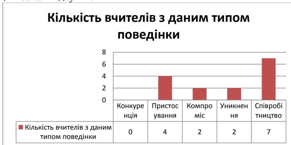
Рис. 2. Вчителі з різними типами поведінки в конфлікті

За даними проведеного тестування серед вчителів було виявлено, що в 46,6% вчителів переважає співробітництво, у 26,6% вчителів переважає пристосування, у 13,3% вчителів переважає компроміс, у 13,3% – уникнення, а конкуренція взагалі відсутня.