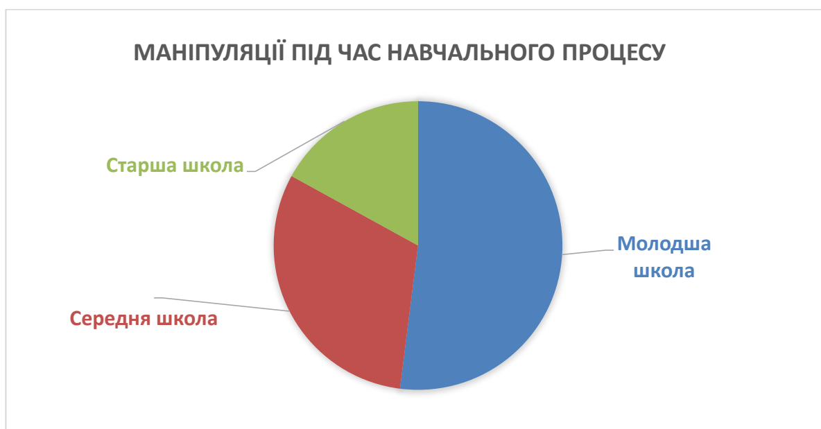
Рис.3 Частота маніпулювання під час навчального процесу.

Також можна зробити висновок, що загальна частота виявлення маніпуляції учнями є наступною: у молодшій школі – 52%, у середній – 31%, у старшій – 17%.