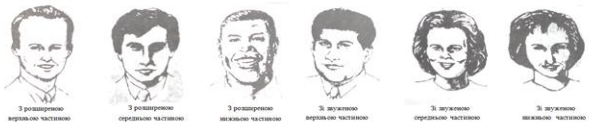
Рис. 2. Типи обличчя за домінуючими зонами

В фізіогноміці часто застосовується метод розділення обличчя трьома горизонтальними лініями, що теж грає велику роль в розумінні характеру людини. Одна з трьох частин, таким чином, може бути дуже розвинена, а інша – не розвинена. Якщо верхня зона (від лінії волосся до брів) розширена, то людина зосереджена на ідеях, любить навчатися, особливо в тій сфері, котра їй близька до душі; розвинена власна думка, вважає за краще робити висновки самому; звужена верхня зона характеризує цілеспрямованих людей. Якщо розширена середня зона (від брів до кінчика носа), то така людина досить амбіціозна, цінує комфорт, свій статус в суспільстві, всіма способами намагається його підтримувати; любить бути першою будь-де і у всьому; звуженість цієї ділянки говорить про трудолюбивість. Якщо розширена нижня зона (від кінчика носа до нижньої точки підборіддя), то її власник – заземлена людина, що в першу чергу розглядає можливість використання якоїсь ідеї на практиці; якщо ця частина звужена – то це люди інтелектуального складу розуму, чутливі до критики [3, с. 41] (Рис. 2)